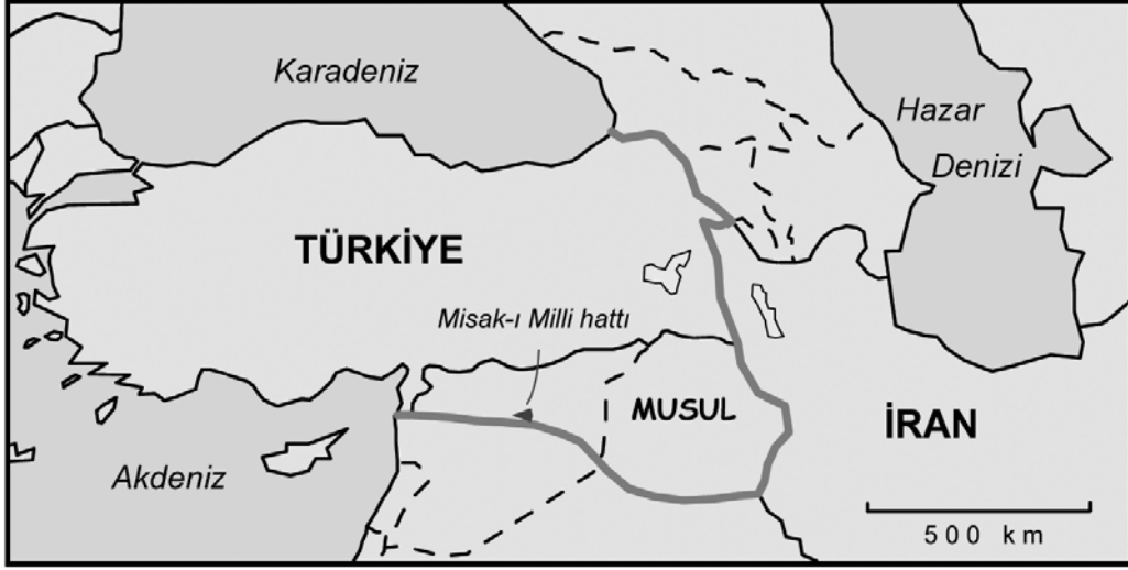
Şekil 2 : Misak-ı Milli hattı, Meclis-i Mebusan, 20 Ocak 1920.